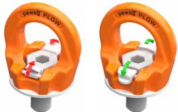
Bild 4: Stellung „A“. Beide Sperren berühren die Schraube. Nur bei Montage und Demontage zulässig

Dieser Anschlagpunkt besitzt ein einfaches System zur werkzeuglosen Montage: