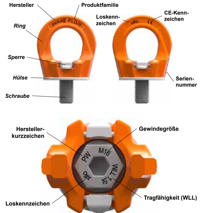
Bild 3: Teilebezeichnung und Ort der Identifizierungsdetails am Produkt

Jeder pewag Anschlagpunkt ist unter anderem gekennzeichnet mit der maximalen Tragfähigkeit bei ungünstigster Belastung, sowie Hersteller- und Loskennzeichen. Das folgende Bild zeigt die Teilebezeichnung und die genauen Identifizierungsdetails am Produkt.