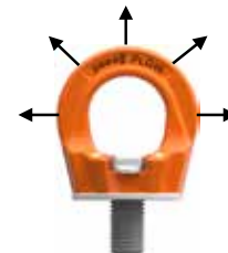
Bild 1: erlaubte Belastungsrichtungen die bei bestimmungsgemäßem Gebrauch auftreten können.

Belastung: Die Belastung darf nur in der vorgegebenen Richtung (Bild 1) mit der maximalen Tragfähigkeit lt. Tabelle 1 und unter Berücksichtigung der hier angegebenen Einsatzbedingungen erfolgen.